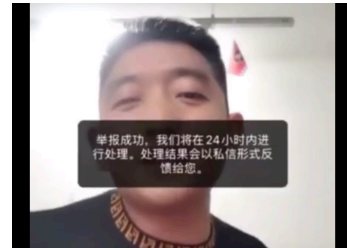
图 3: 被举报了，准备引发纷争